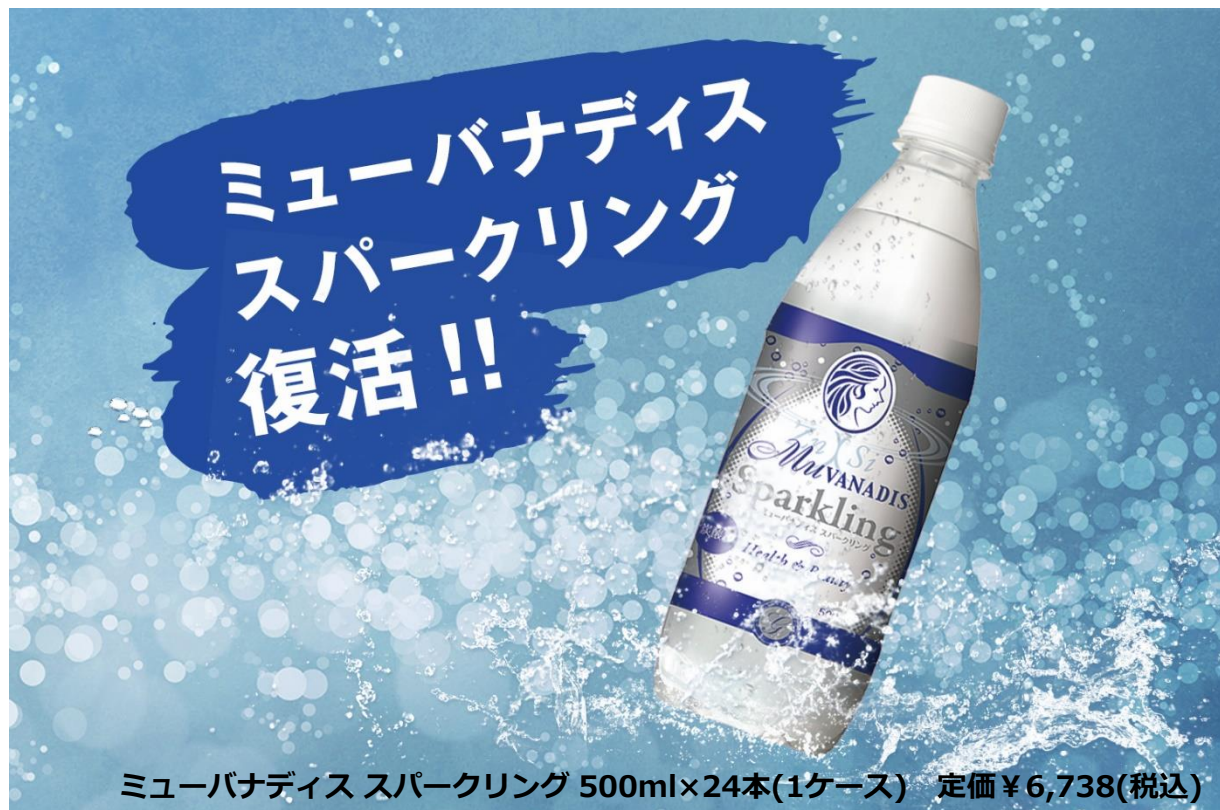
ミューバナディス スパークリング 500ml×24本(1ケース) 定価¥6,738(税込)

販売開始前から多くのお問合せを頂いているミューバナディス スパークリング。今年も4/17(月)から数量限定で販売開始が決定いたしました。