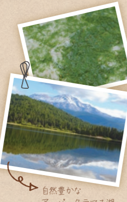
自然豊かなアッパークラマス湖

アメリカのアッパー・クラマス湖に自生する希少な藍藻類のこと。35億年前から現在まで、何度も地球環境の激変を乗り越えて生き残ってきた、パワフルな生命力を持つ世界最古の生物のひとつです。アッパー・クラマス湖は環境保護地区にあるため、環境汚染などとは無縁の雄大な自然の中でその命は受け継がれてきました。化粧品やサプリメントに活用されるようになった現在でも、育つ過程では人の手は一切加えられないことがないのだそうです。今もなお太古の昔と変わらないワイルドな生命力に満ちた貴重な素材といえます。50種のミネラル、13種のビタミン、20種のアミノ酸、2種の色素、4種の脂肪酸を含有し、NASAでは宇宙食としても研究され、スーパーフードとしても人気が高く、サプリメントとしても活用されています。